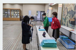
2次元コードを使って 受付