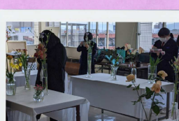
体験：春の花を描いて見よう