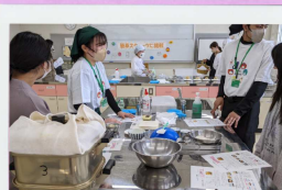
学生と一緒に体験しました