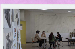
教員との個別相談