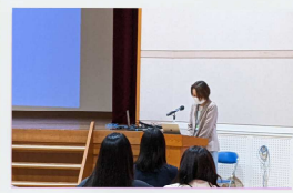
全体会場は講堂ホールで