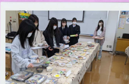
食育 SAT システムを 使って食事バランス診断!