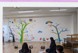
カラーテープを使って 壁画制作をしてみよう