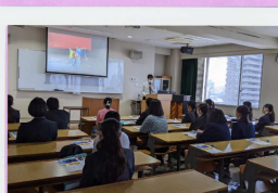
子ども学科はどのようなことを学 ぶの?